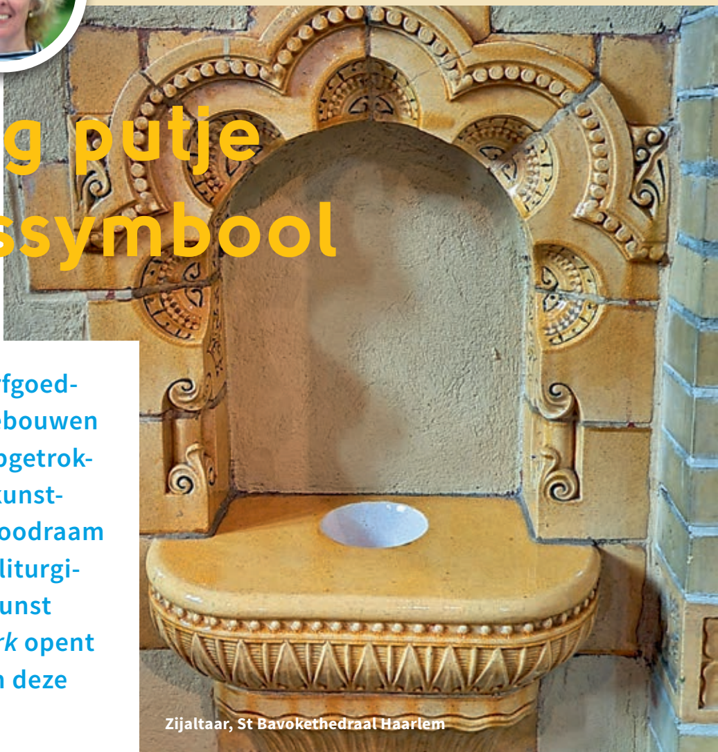
Zijaltaar, St Bavokathedraal Haarlem

Parochies en kerken zijn erfgoeden en schatbewaarders. De gebouwen zijn in een bepaalde stijl opgetrokken. In iedere kerk zijn er kunstschatten: van een glas-in-loodraam tot een heiligenbeeld, van liturgische voorwerpen tot aan kunst met een grote K. SamenKerk opent voor u een klein kiertje van deze schatkamer.