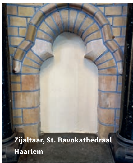
Zijaltaar, St. Bavokathedraal Haarlem