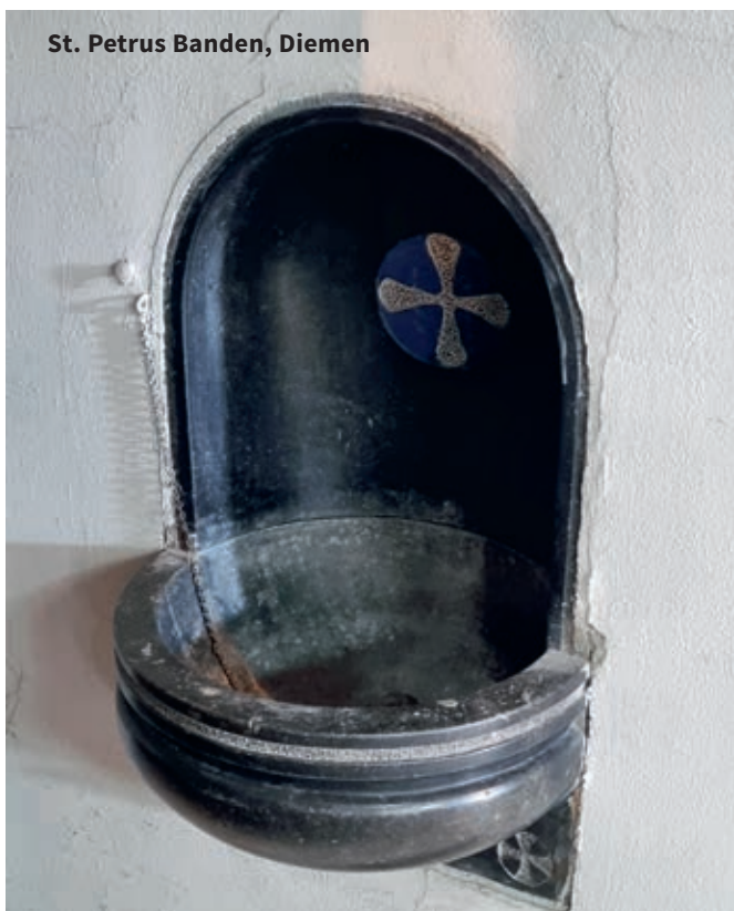
St. Petrus Banden, Diemen

De aquamanile - Latijn voor water (aqua) en hand (manus) - wordt ook veel gebruikt voor de handenwassing in kerk en huis en lijkt op een soort gieter in de vorm