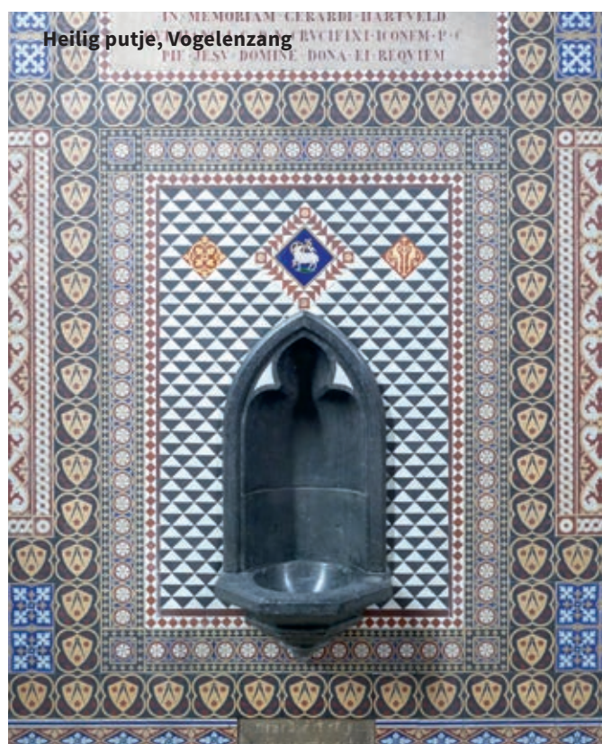
Heilig putje, Vogelenzang

B egin jaren negentig van de vorige eeuw stuitten parochianen van de kerk Onze Lieve Vrouwen Hemelopneming in Vogelenzang in het priesterkoor van hun kerk op een heilig putje. Het was vele jaren aan het oog onttrokken geweest door een lap stof, die de driezijdige apsis bekleedde. Tot in de achttiende eeuw was in vrijwel elke katholieke kerk een heilig putje te vinden, nabij het hoofdaltaar. Maar gaandeweg verloor het zijn functie en werd het dichtgemetseld of werd er een tabernakel of credens van gemaakt. In nieuwe kerken, zoals die in Vogelenzang, was het zeer ongebruikelijk om heilige putjes in het ontwerp mee te nemen. Wat is het verhaal achter dit in onbruik geraakte putje? Een heilig putje, ook wel lavabo, sacrarium of piscina genoemd, bevindt zich doorgaans in de apsis van een kerk aan de rechterkant van het hoogaltaar in een nis. Soms uitbundig gedecoreerd, in andere gevallen is