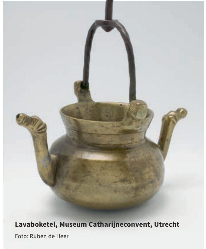
Lavaboketel, Museum Catharijneconvent, Utrecht