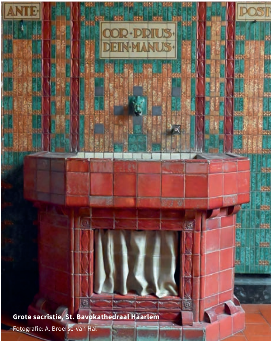
Grote sacristie, St. Bavokathedraal Haarlem